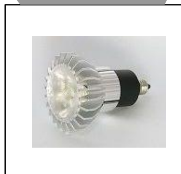
ハロゲン形 LEDランプ